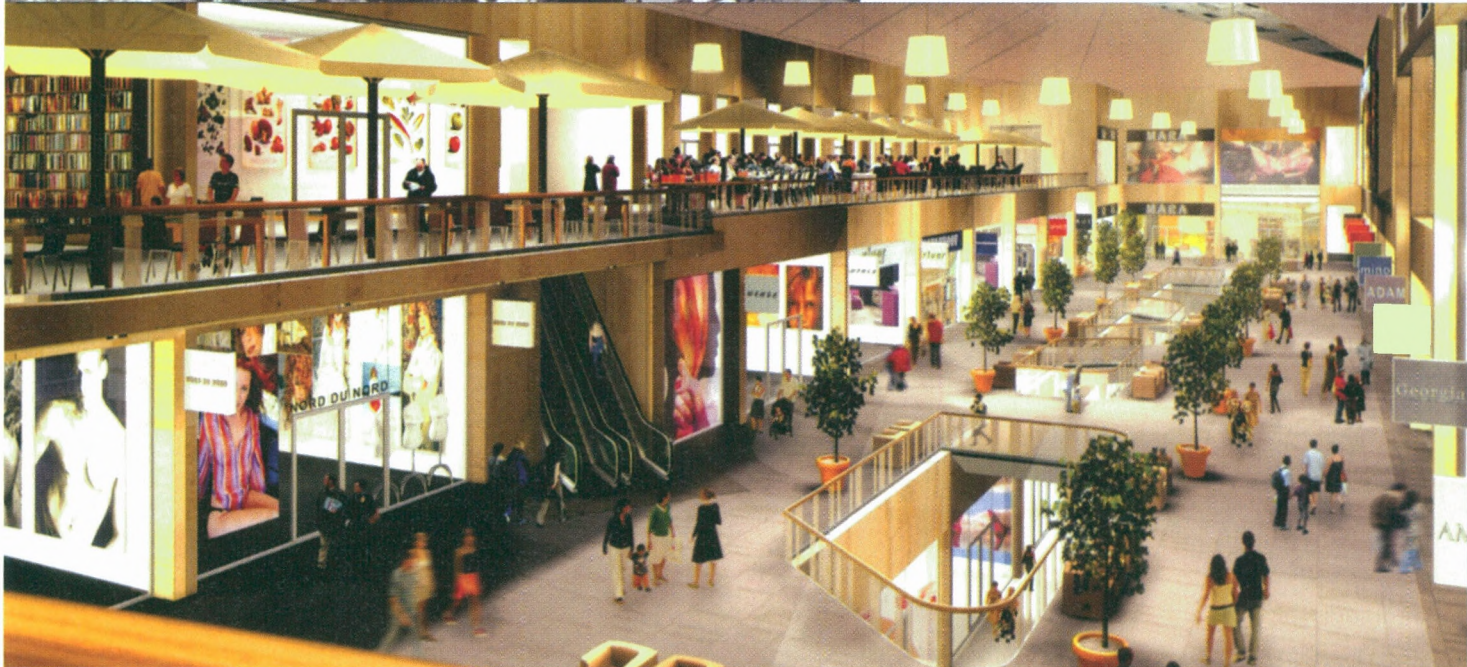
■ Ontwerp van het project Foruminvest, waarbij de functies wonen, winkelen, ontspannen en parkeren gecombineerd zullen worden in het centrum van Kortrijk.